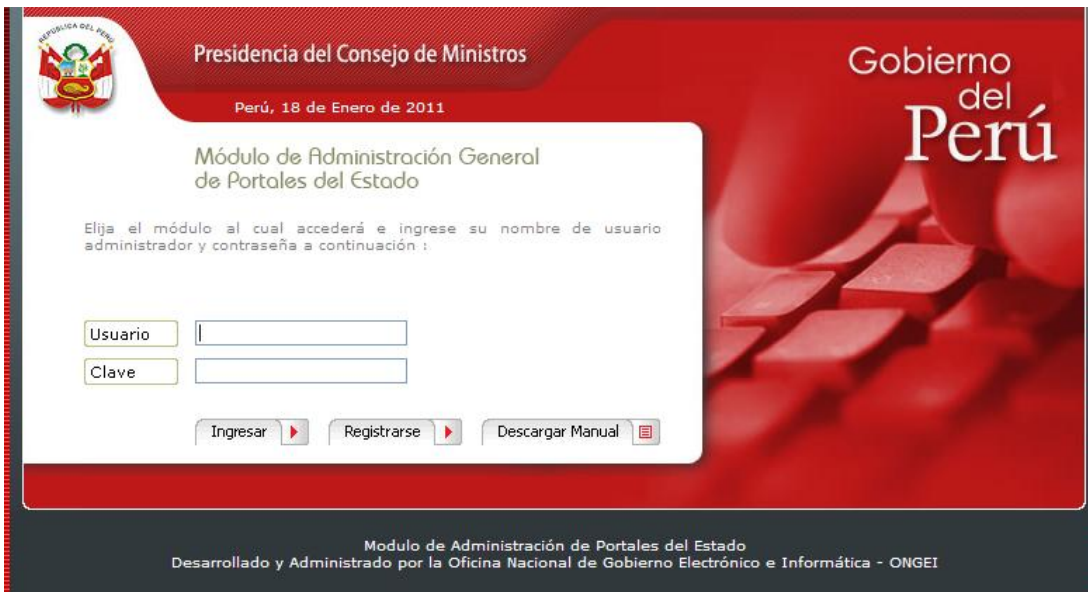
Fig. 1 Pantalla de inicio

La dirección del modulo de Mantenimiento es la que se muestra a continuación: http://www.peru.gob.pe/nuevo_portal_municipal/admin/gen_inicio.asp (Ver Fig. 1)