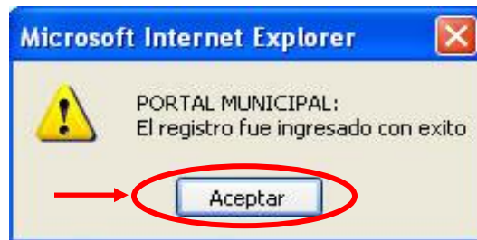
Fig. 3.3.5 Mensaje de Ingreso