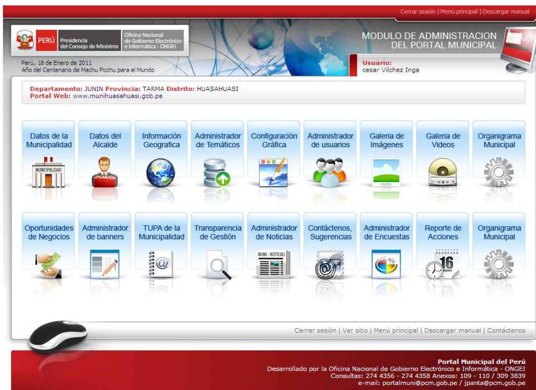
Fig. 3 Menú de opciones

Es el responsable de administrar la información en el Portal Municipal de su entidad, tendrá acceso general para administrar su Web con las opciones que se visualizan en la siguiente pantalla ( Ver Fig. 3 ).