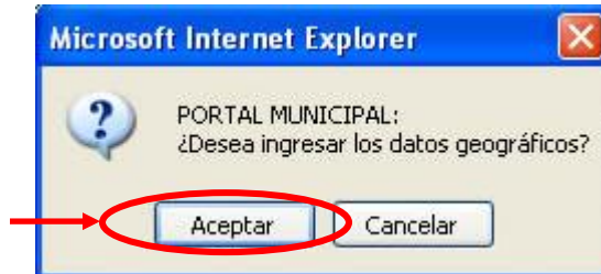
Fig. 3.3.4 Registro de información geográfica

Luego llenado los datos de ubicación, extensión y temperatura debemos dar en la opción “ Grabar ” y aceptamos las confirmaciones respectivas para grabar estos registros (Ver Fig. 3.3.4) y (Ver Fig. 3.3.5)