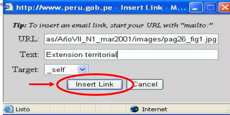
Fig. 3.3.3 Ingreso de Link

En este pequeño formulario colocaremos el “ URL ” que es la dirección web de donde será llamado el enlace, el campo “ Text ” para ingresar la descripción que aparecerá en el link, seguido damos clic en la opción “ Insert Link ”.