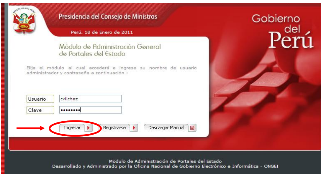
Fig. 2 Ingreso de usuario y clave

Ingresamos el usuario y clave como se muestra (Ver Fig. 2)