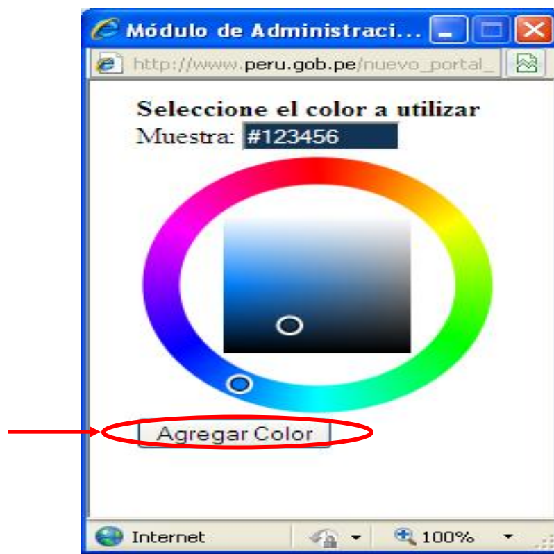
Fig. 3.5.2 Selección de colores

Para cambiar el color de la cabecera seleccionamos la opción “Color de fondo de cabecera de la página” (Ver Fig. 3.5.1) y se visualiza la siguiente ventana (Ver Fig. 3.5.2)