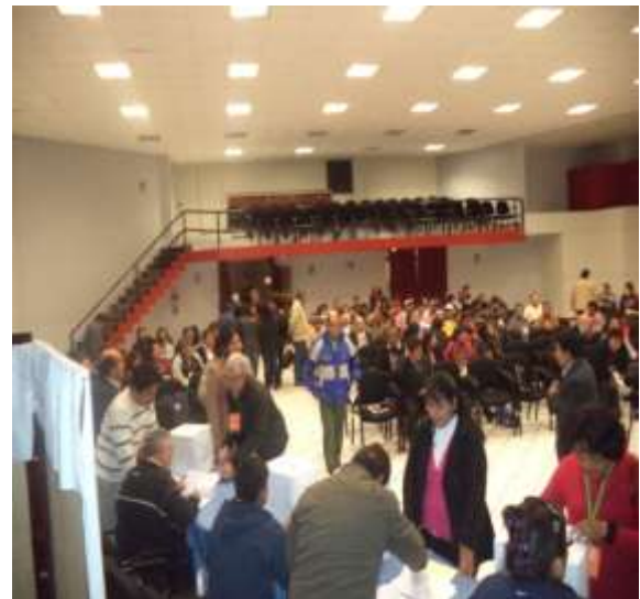
PRESENTACIÓN DE LOS CANDIDATOS Y ACTO DE VOTACIÓN PARA LA ELECCIÓN DE PRESIDENTE Y VICEPRESIDENTE DE LA MESA DIRECTIVA Y COMITÉ DE VIGILANCIA