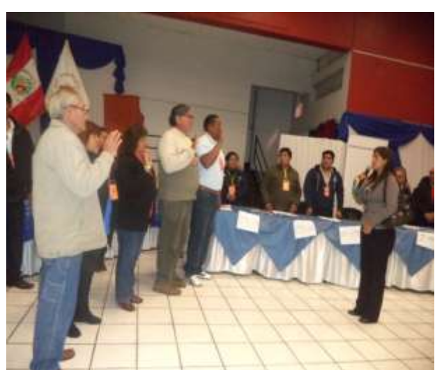
JURAMENTACIÓN DE LOS PRESIDENTES DE LA MESA DIRECTIVA Y COMITÉ DE VIGILANCIA