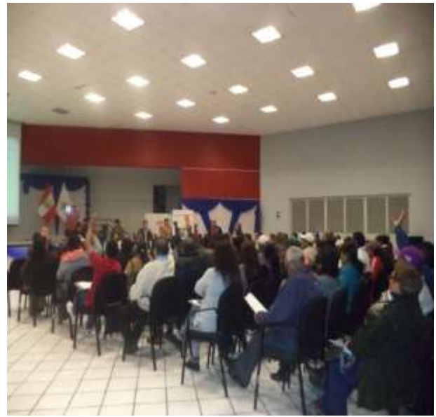
ELECCIÓN DEL COMITÉ ELECTORAL PARA LA DESIGNACIÓN DE PRESIDENTE Y VICEPRESIDENTE DE LA MESA DIRECTIVA Y COMITÉ DE VIGILANCIA DEL PRESUPUESTO PARTICIPATIVO 2015